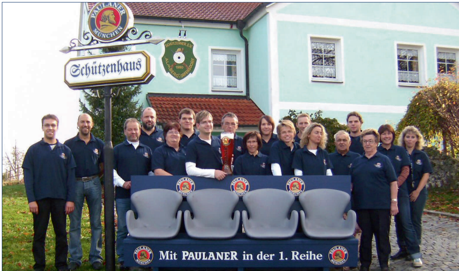
Das sind die glücklichen Gewinner der Fanbank-Verlosung von Paulaner: Bei den „Flopers Irfersdorf“ hat die Bank jetzt einen Ehrenplatz im Schützenhaus. Die Runde „Beim Biermichl“ schafft mit der Fanbank echte Stadionatmosphäre beim gemeinsamen Fußballschauen.