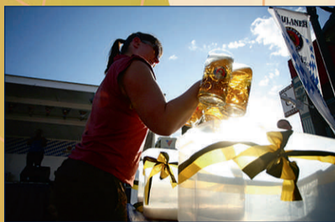
Denver (Colorado), USA