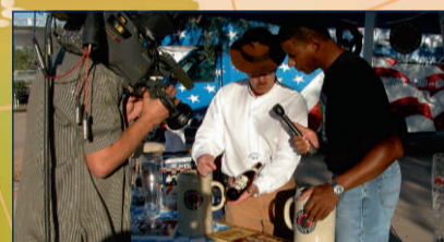
Tempe (Arizona), USA