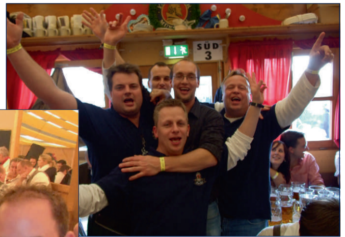
Mit Paulaner auf das Oktoberfest: Über 300 Fans konnten sich über eine Einladung freuen, wie z.B. die „Paulaner Jungs“ (großes Bild) und die „Weißbierbazis“ (unten).

liegendem Faxbogen anfordern – es gibt immer wieder tolle Gewinne!