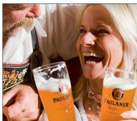
Paulaner Weißbier steht für Lebensfreude und hat eine lange Geschichte.

Die Kohlensäureperlen haben einen langen Weg, um nach oben zu steigen. Dadurch bleibt das Bier länger frisch und spritzig. Der verstärkte Glasboden dient übrigens auch dazu, um mit dem obergärigen Bier traditionsgemäß „unten“ anzustoßen.