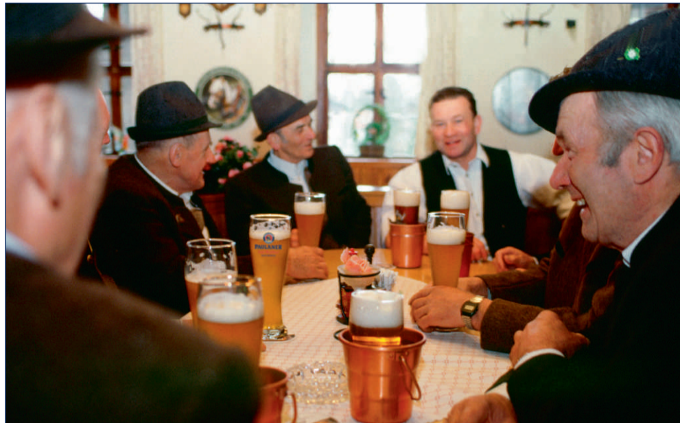
Der Stammtisch ist ein beliebter Treffpunkt unter Freunden.

Na ja, ganz so streng wird das heute nicht mehr gehandhabt. Doch bis weit in die Hälfte des 20. Jahrhunderts hinein saßen vor allem in ländlichen Regionen nur die örtlichen Honoratioren am Stammtisch. Dazu gehörten Bürgermeister, Ärzte, Lehrer oder wohlhabende Landwirte. Heute bestimmen Prestige und Ansehen nicht mehr über den Platz am Stammtisch. Viel