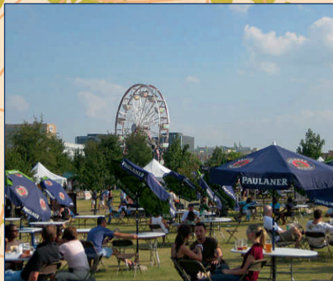
Addison (Vermont), USA