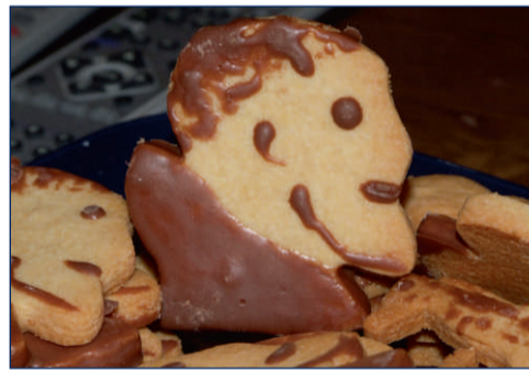
Einzigartig: Plätzchen im Paulaner Design.

Aber auch sonst ist die Truppe ständig auf Achse und bringt sich positiv ins Dorfgeschehen ein. Sie sorgen für die Erneuerung des örtlichen Grillplatzes, stellen den jährlichen Maibaum auf und organisieren auch das dazugehörige Maibaumfest. Und dabei haben die Paulaner Fans natürlich immer jede Menge Spaß. Kein Wunder, dass ihr Motto lautet: „Schluss mit lustig – jetzt wird's spaßig!“