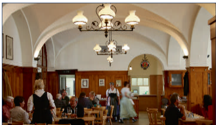
Neuer Glanz in historischem Gebäude: Die Großmarkthalle ist trotz Renovierung nach wie vor urig.

hallen, wo immer reger Betrieb herrscht und die Händler ihre frischen Lebensmit-