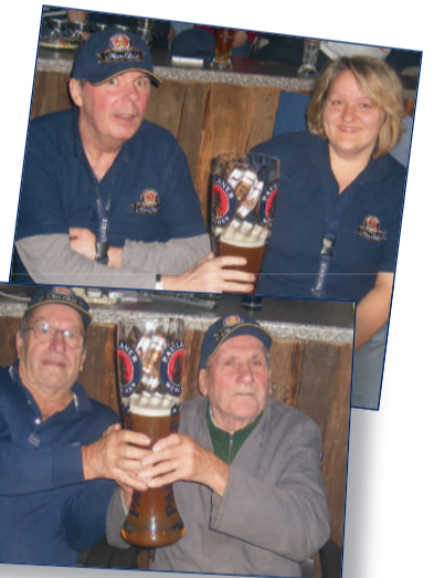
Groß war die Freude über den Gewinn der Fanbank - bei Jung und Alt.

FAN-FRAGE – In jeder Ausgabe beantwortet ein Paulaner Experte eine Fan-Frage