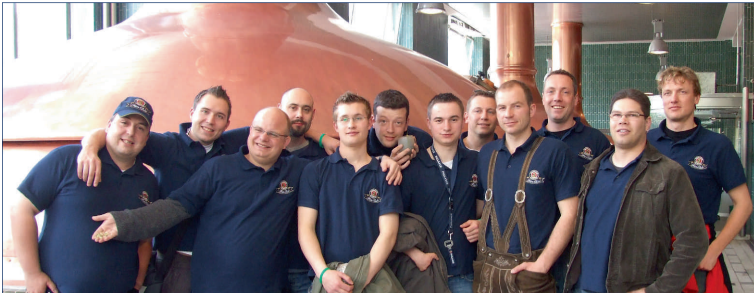
Die Mitglieder der Paulaner Runde „Räumle Oberalfingen“ bei einer Paulaner Brauereiführung.

DIE PAULANER RUNDE „RÄUMLE OBERALFINGEN“ MIT 18 MITGLIEDERN STELT SICH VOR