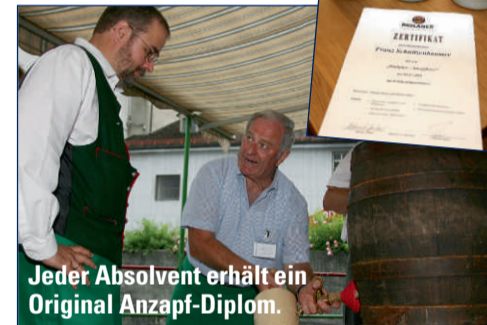
Jeder Absolvent erhält ein Original Anzapf-Diplom.