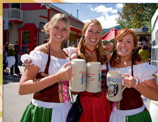
Breckenridge (Colorado), USA