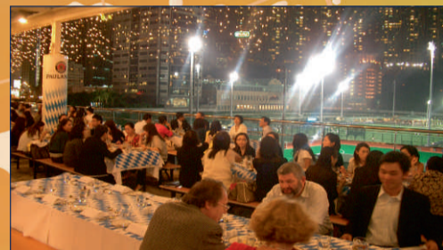
Hong-Kong Jockey Club, China