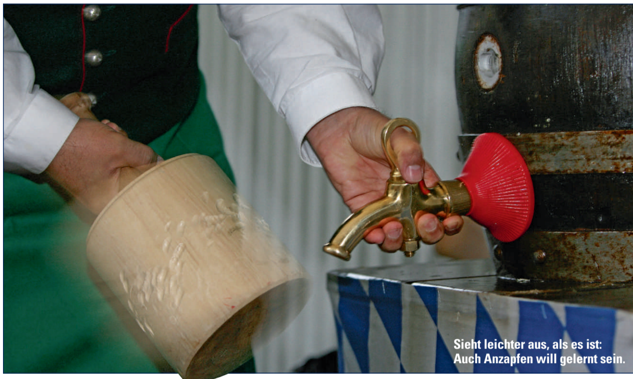
Sieht leichter aus, als es ist: Auch Anzapfen will gelernt sein.

JETZT GEWINNEN: ANZAPFKURSE BEI PAULANER FÜR DREI PAULANER RUNDEN