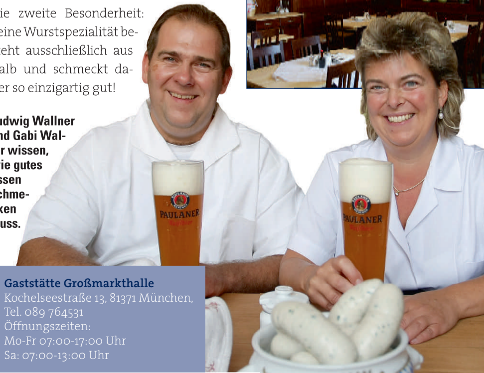
Gaststätte Großmarkthalle Kochelseestraße 13, 81371 München, Tel. 089 764531 Öffnungszeiten: Mo-Fr 07:00-17:00 Uhr Sa: 07:00-13:00 Uhr